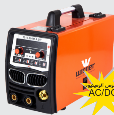
Power 5010-200 M.A DP