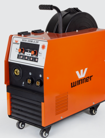
HI Power 6850-300 M.A