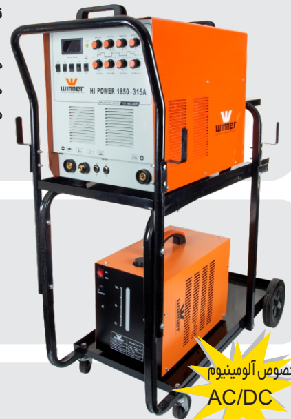
HI POWER 1850 - 315A