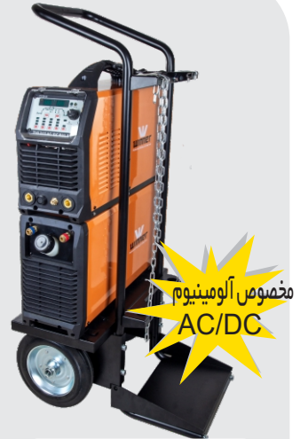
TIG 315 AC/DC PULS